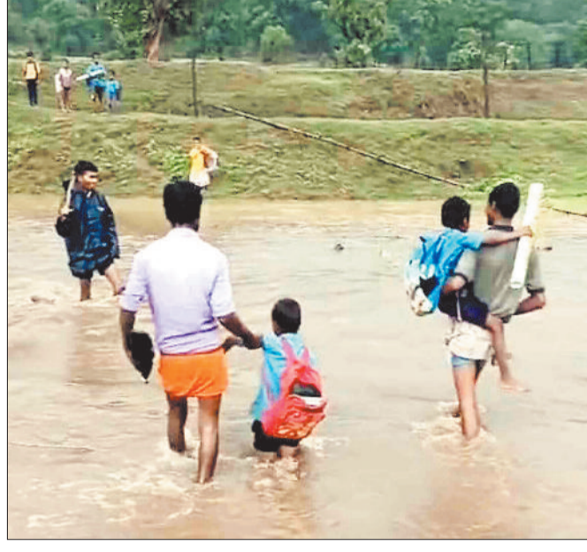
उफनते नाला को पार करते परिजन के साथ स्कूली बच्चे।

नदी-नालों पर पुल-पुलियों का निर्माण नहीं होने के कारण बच्चों को अपना भविष्य गढ़ने के लिए खतरे के बीच उफनते नदी-नालों को पार कर स्कूल जाना पड़ रहा है। ग्रामीण दर्शकों से नाले पर पुलिया निर्माण करने की मांग कर रहे हैं लेकिन क्षेत्र के जनप्रतिनिधि एवं अधिकारियों द्वारा इस दिशा में कोई कारगर पहल नहीं हो सकी है। विकासखण्ड ओडगी के दूरस्थ चांदनी-बिहारपुर क्षेत्र में कई ऐसे गांव हैं जो पुल-पुलियों के अभाव में बरसात में टापू बन जाते हैं। पुल-पुलियों के अभाव में बच्चों एवं मरीजों को भारी परेशानी का सामना करना पड़ता है। प्रभावित क्षेत्र के ग्रामीणों का कहना है कि वे विभिन्न माध्यमों से क्षेत्र के जनप्रतिनिधियों एवं अधिकारियों को अनेकों बार स्थिति से अवगत करा चुके हैं लेकिन अभी तक इस बड़ी समस्या के निराकरण के लिए कोई पहल नहीं हो सकी है। दूरस्थ ग्राम पंचायत स्थित प्राथमरी स्कूल के दो नालों से घिरे होने के कारण ग्रामीणों को तो आवागमन में समस्या होती है सबसे बड़ी समस्या छोटे बच्चों को हाती है। प्राथमिक शाला के उत्तर दिशा में बेवदी नाला जबकि दक्षिण दिशा में बाघबुड़वा नाला बहता है जिसके कारण ग्राम पंचायत के पहाड़पारा एवं