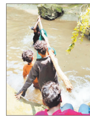
सम्मान और प्रेरणा का पात्र

गहरी खाई से महिला को साड़ी और डंडे की मदद से बाहर निकाला गया। 5 किलोमीटर पैदल यात्रा करनी पड़ी, जिसमें घना जंगल, नाले, गहरा पानी, अजगर और उसके बच्चे जैसी कठिनाइयां थीं। जोखिम उठाते हुए भी युवाओं ने अपने प्राणों की परवाह किए बिना महिला को खड़गावां सामुदायिक स्वास्थ्य केंद्र पहुंचाया। यह कार्य सिर्फ साहस का नहीं, बल्कि जीवन के प्रति संवेदनशीलता और समाज के प्रति कर्तव्य बोध का परिचायक है।