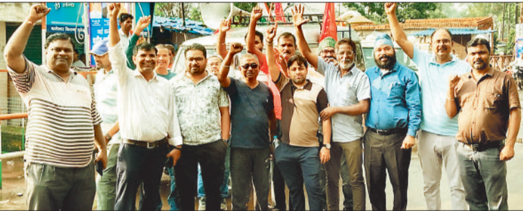
हड़ताल में शामिल श्रमिक।