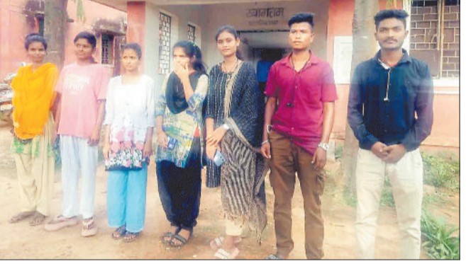
हरिभूमि न्यूज प्रतापपुर

आईटीआई के विद्यार्थियों ने प्रिंसिपल पर अमद्रता का आरोप लगाया है। विद्यार्थियों के कहना है कि उपस्थिति का हवाला देकर न सिर्फ परीक्षा फॉर्म भरने से मना कर बैठने से वंचित किया जा रहा है बल्कि उन्हें आईटीआई से धक्का देकर बाहर निकाल दिया गया है। इधर छात्रों परीक्षा में बैठने दिए जाने की मांग की है साथ ही प्रिंसिपल के विरुद्ध कार्रवाई किए जाने की मांग की है। आदिवासी छात्र-छात्राओं को प्रतापपुर अमनदोन में स्थित शासकीय आईटीआई में कोपा, इलेक्ट्रीशियन, वेल्डर का प्रशिक्षण