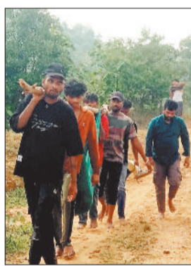
रेस्क्यू ऑपरेशन की प्रमुख चुनौतियां