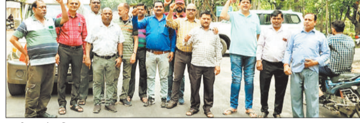
प्रदर्शन करते श्रमिक।