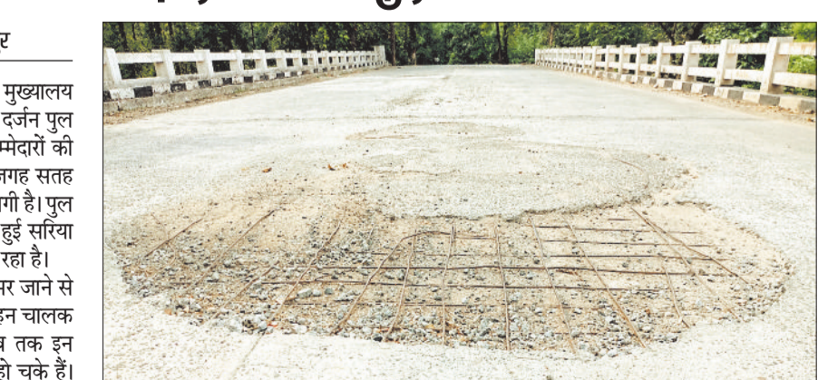
जर्जर अवस्था में पुल।

बारिश के दिनों में गड्ढों में पानी भर जाने से गड्ढे नजर नहीं आते और दुपहिया वाहन चालक अक्सर दुर्घटनाग्रस्त हो जाते हैं। अब तक इन गड्ढायुक्त पुलों से कई लोग घायल हो चुके हैं। इस मार्ग से होकर जिला मुख्यालय मनेन्द्रगढ़ जाने वाले वाहन चालकों ने बताया कि विभागीय अधिकारियों की अनदेखी की वजह से समय-समय पर पुलों की मरम्मत कार्य नहीं हो सके हैं। जनकपुर से कठौतिया मार्ग की आधा दर्जन पुलों की सतह अब उखड़ चुके हैं और लोहे की सरिया बाहर आ चुकी है, जिससे वाहन चालकों के लिए यह मार्ग अत्यंत जोखिम भरा हो गया है। बावजूद